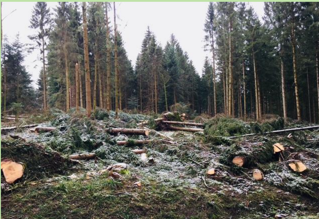
Winterstürme Januar 2018 grosse Schäden in ganz Europa.