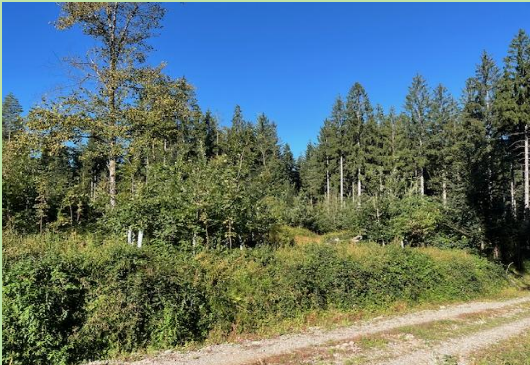
Der «neue» Wald mit Eichen, Ahorn und Fichten im Oktober 2025

Die Aufforstung Truppweise, 10-15 Bäume, ermöglicht das die bestehende Verjüngung ebenfalls gefördert wird und ein neuer Mischwald entsteht.