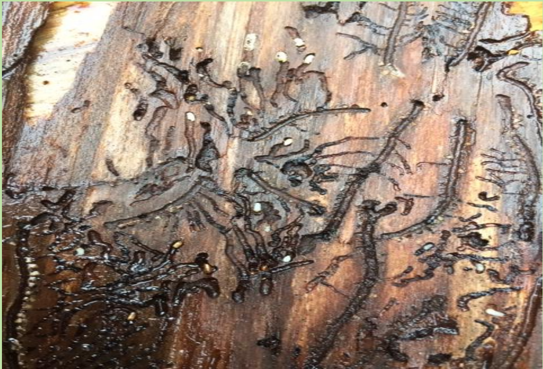
Die weissen Käferlarven in der Rinde einer Fichte