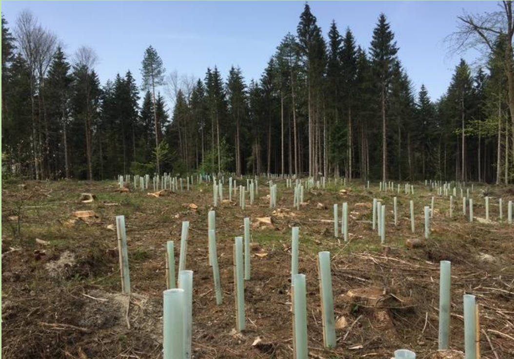
Aufforstung Truppweise von Eichen April 2019

Die Aufforstung Truppweise, 10-15 Bäume, ermöglicht das die bestehende Verjüngung ebenfalls gefördert wird und ein neuer Mischwald entsteht.