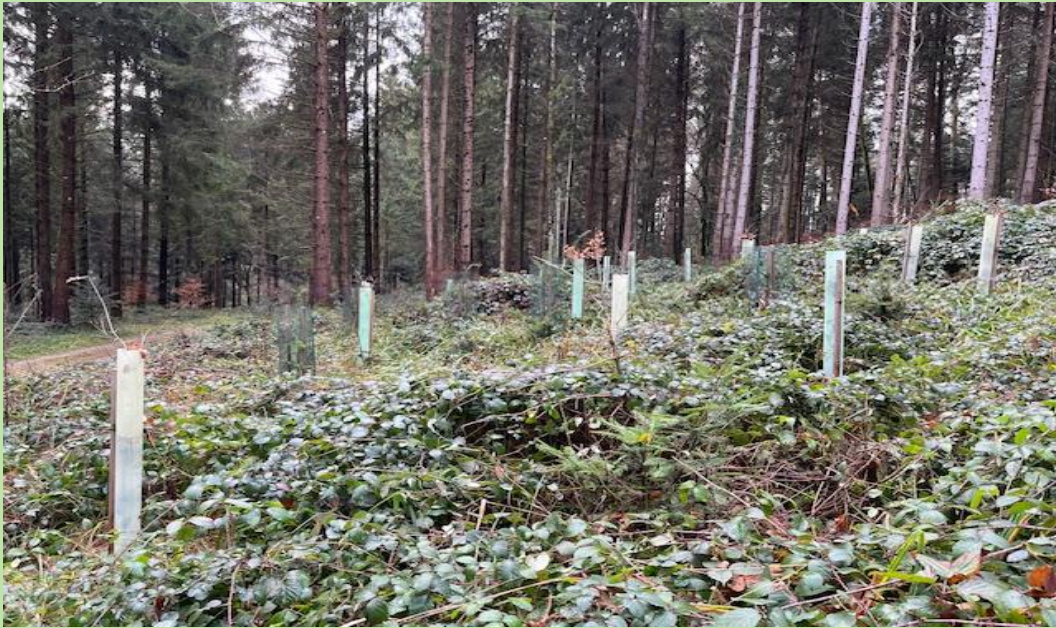
Wiederaufforstung mit Einzelschutz in einer Fläche mit starkem Brombeerenbewuchs.