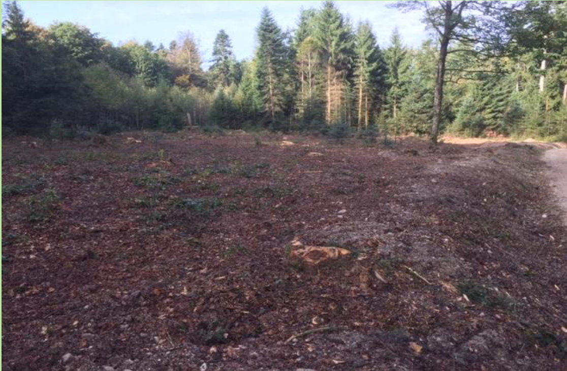
Die befallenen Fichten wurden entfernt und Fläche zum Pflanzen vorbereitet.