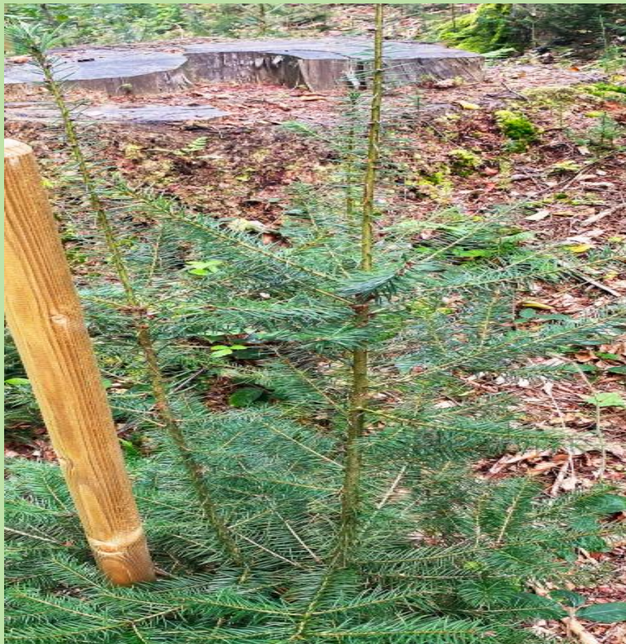
2 Jahre nach der Wiederaufforstung mit einer Douglasie.